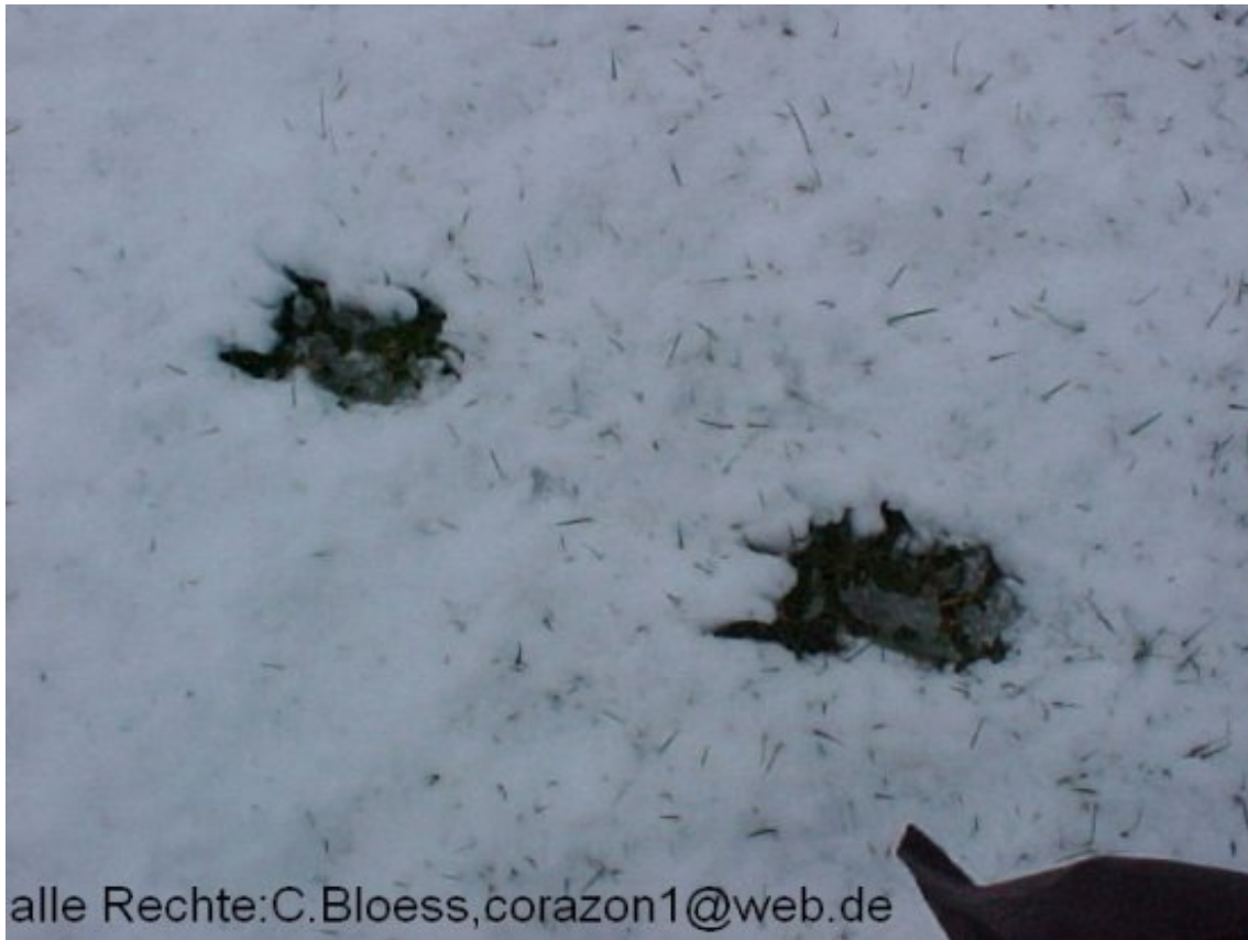
(Spuren, die ich eines frühen Wintermorgens in meinem Garten fand)

Gelegentlich wird diese Deutung (Drudenfuß=Fußabdruck) aber auch als bizarr und Irrtum bezeichnet. Vielleicht ließe die magische Macht des Pentagramms gepaart mit dem Volksglauben zuweilen auch einfach keine andere Deutung zu, als sie auf diejenigen übernatürlichen Wesen zuzuschreiben, die uns seit Menschengedenken aufsuchten. Deutlich spiegelt sich da die Annahme wieder, dass "Wesenheiten" komische oder verkrüppelte Füße besitzen - ihnen offenbar diejenige Verbindung zum Weltlichen fehlt, denen wir selbst ausgeliefert sind.