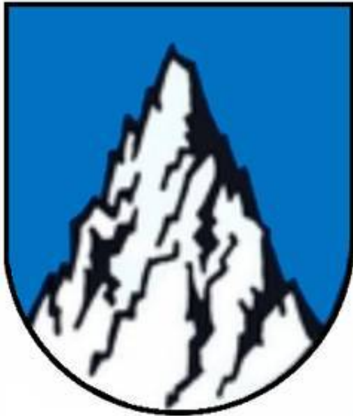
Weiler zum Stein

Tiger-Cars?? In den vergangenen Wochen standen einige Tiger-Vorkommnisse im Fokus der Öffentlichkeit; so wurden z.B. Dompteure von ihren Tigern angegriffen, wobei im Falle des beim "Pagelâ€™s Dinner Circusâ€™œ verletzten Hamburgers Christian Walliser deutliche Verbindungen zum Winnenden Fall bestanden: Der Name Walliser verweist auf Wallis, Schweiz, und damit auf das Matterhorn. Prominentestes Opfer einer Tigerattacke war Roy HORN ('Siegfried & Roy'), der im Mirage (frz. fÃ¼r Fata Morgana) von seinem Tiger Montecore beinahe totgebissen wurde. Achten wir also auf das 'Hornâ€™ (Matterhorn - the horn matters): Das Matterhorn fÃ¼hrt uns nach Winnenden, oder besser gesagt zu Tim Kretschmers Heimatort, "Weiler zum Stein", und dessen ehem. Wappen: