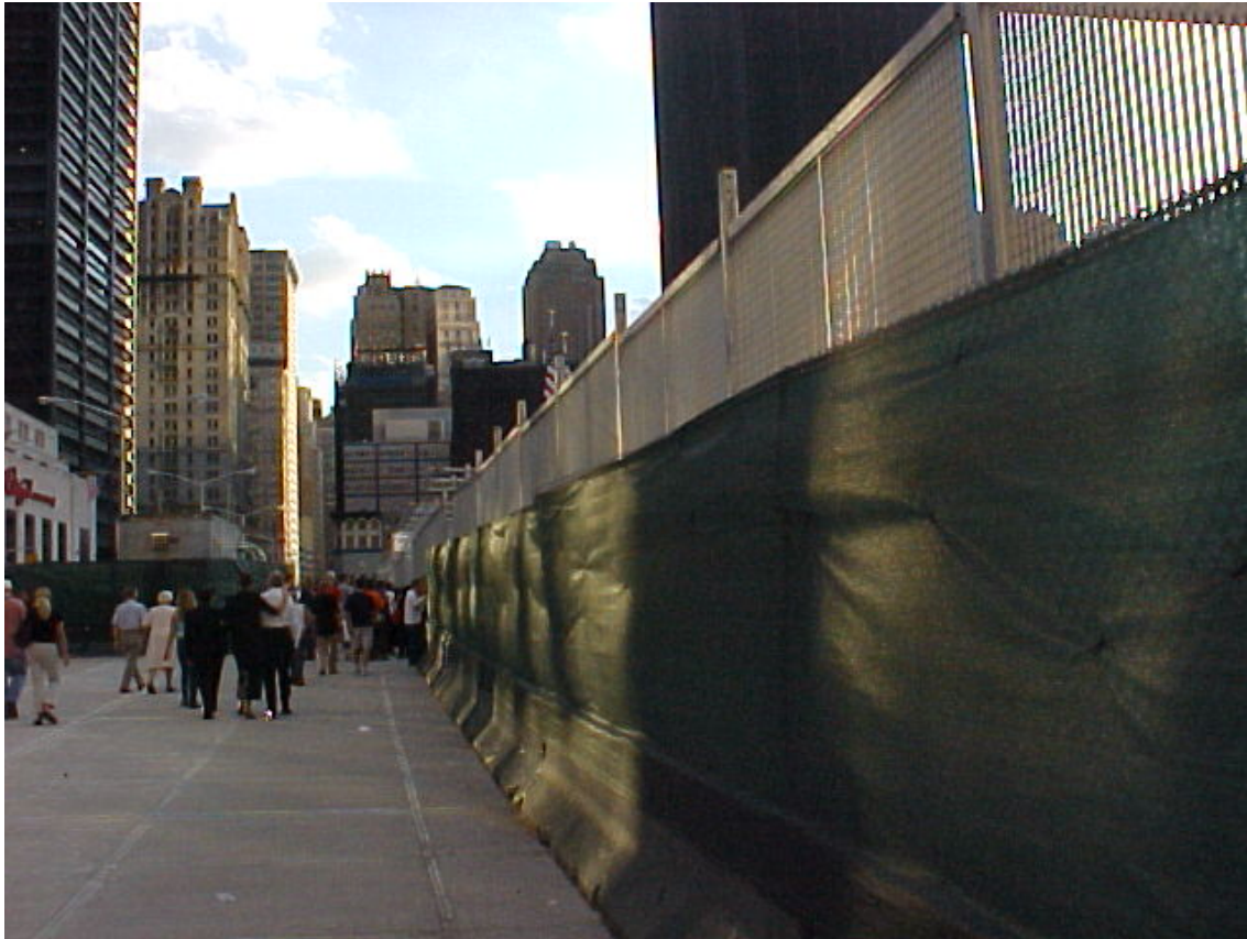
Absperrung am Ground Zero, Foto: Corinna