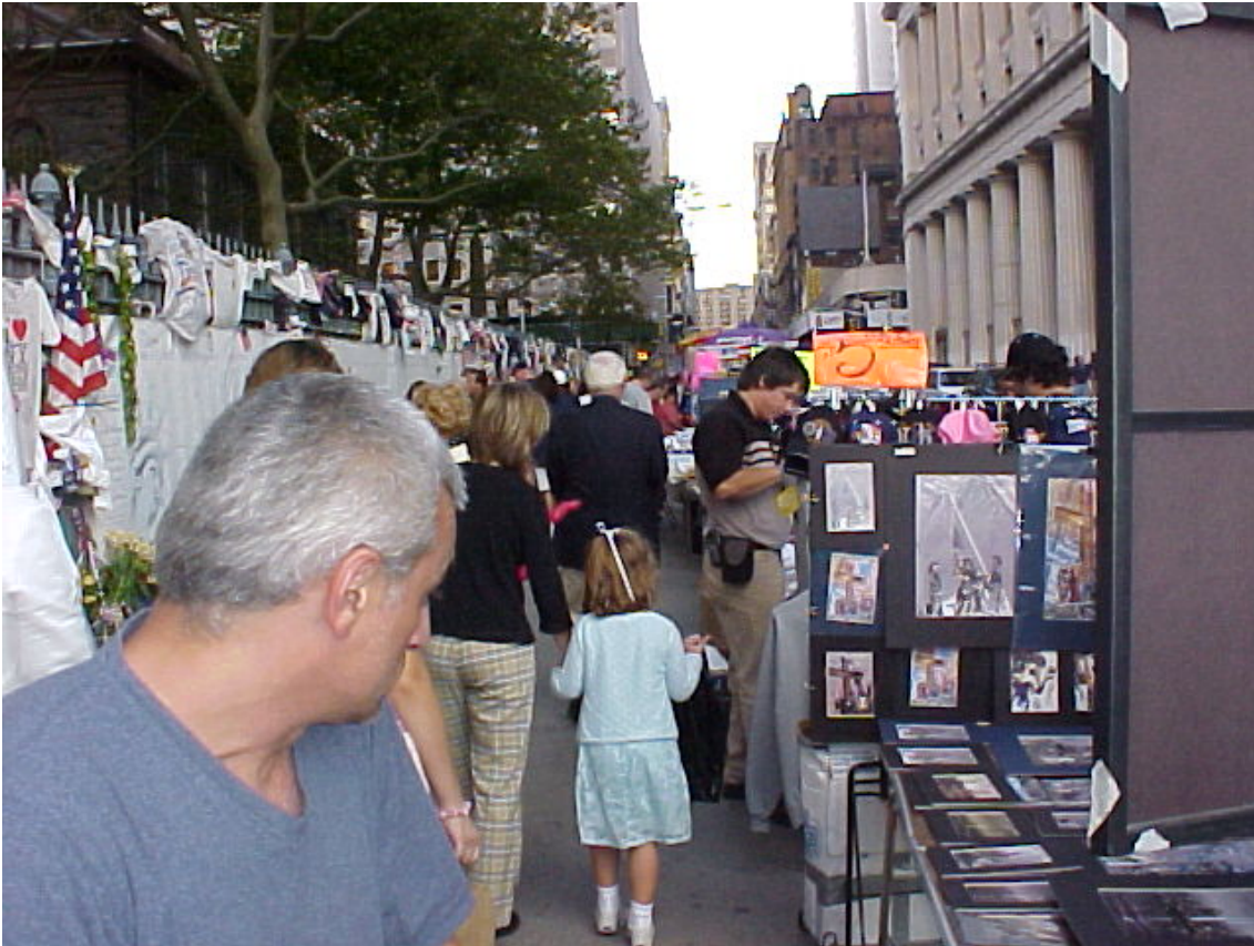
Flohmarkt am Ground Zero