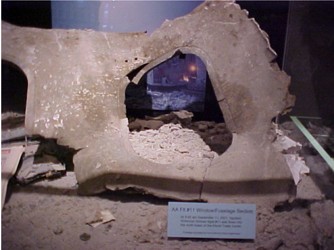
Teil eines Flugzeugs, das ins WTC raste, in einem NY'er Museum